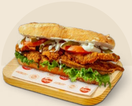
Milanesa de res