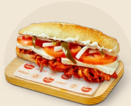
Mixto (panela + pierna)