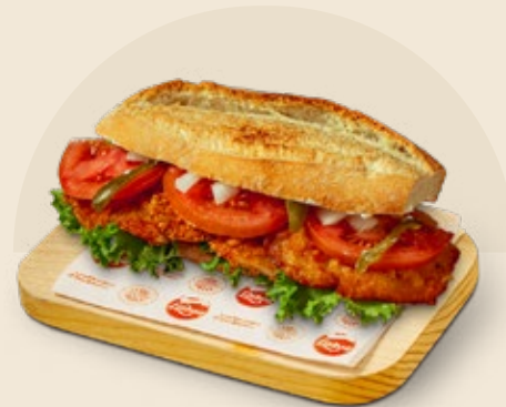
Milanesa de pollo