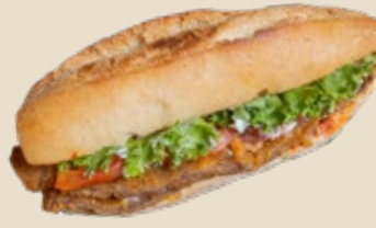
Milanesa de res