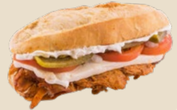
Mixto (panela + pierna)