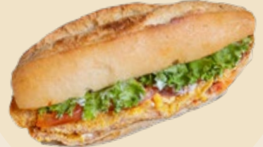
Milanesa de pollo