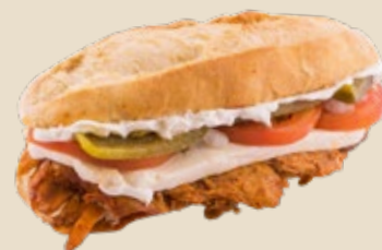
Mixto (panela + pierna)