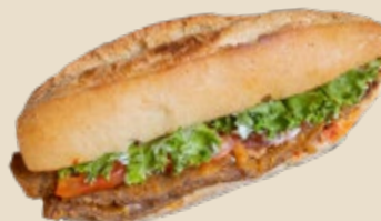
Milanesa de res